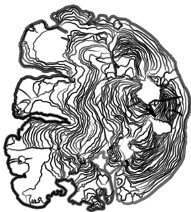
Olea europaea (5000 Años < 12 000 Años)